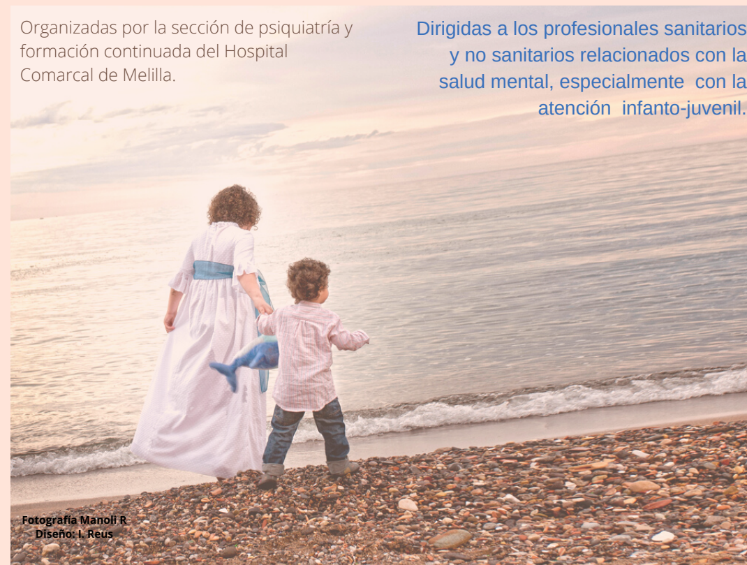
Diseño: I. Reus

Dirigidas a los profesionales sanitarios y no sanitarios relacionados con la salud mental, especialmente con la atención infanto-juvenil.